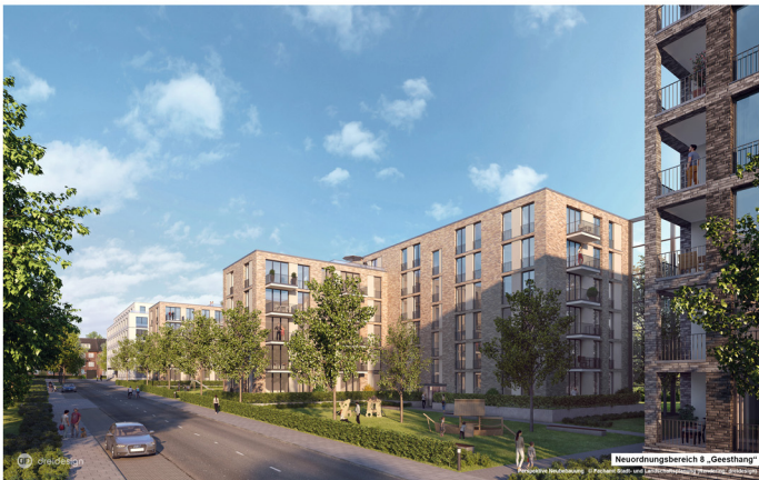
Neuordnungsbereich 8 „Gresham“