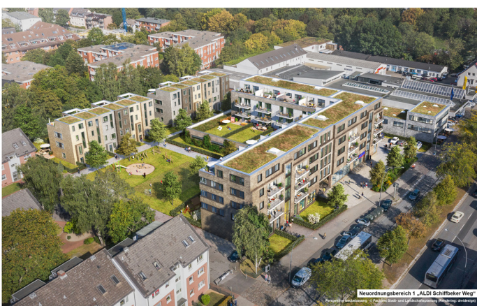
Neuordnungsbereich 1 „ALDI Schiffbeker Weg“