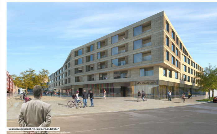
Neuordnungsbereich 12 „Möllner Landstraße“