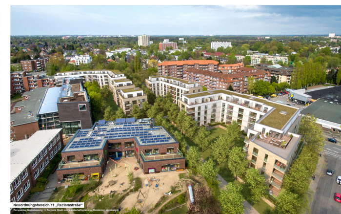
Neuordnungsbereich 11 „Reclamstraße“

Kartengrundlage: Liegenschaftskarte 1000 FA, Freie und Hansestadt Hamburg, Landesbetrieb Geoinformation und Vermessung